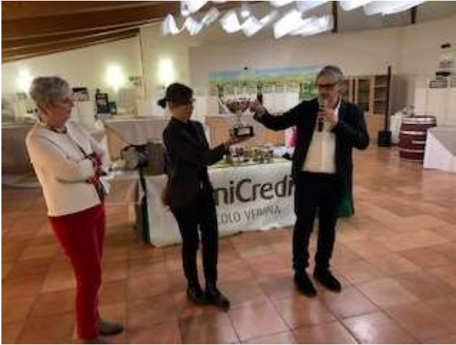
Trofeo Sfida Milano – Verona (vinto dal Circolo Verona)